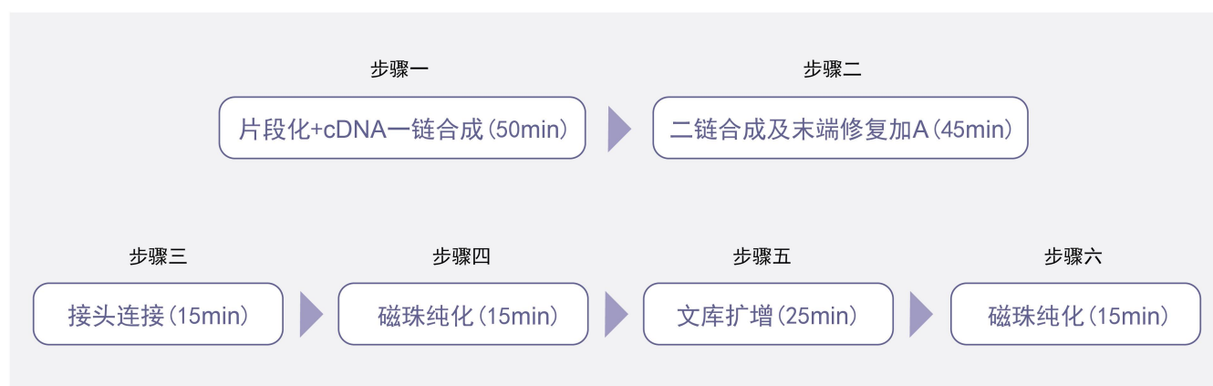
图 1. xLibPreP™通用型 RNA 建库试剂盒 (MGI) 操作流程图